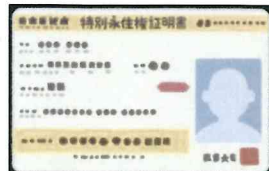
特別永住権証明書