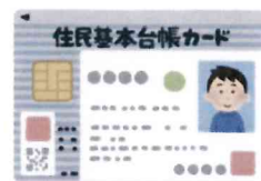
住民基本台帳カード