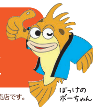
ぼっけのポーチゅん