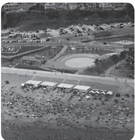
多くの人で賑わった菖蒲田海水浴場(上空より撮影)

連日暑い日が続いた今夏でしたが「ハマの夏、全開」をコンセプトに期間中は様々なイベントが開催されました。台風12号の影響で7月28日のTBC夏まつり2018は中止となりましたが、8月11日に延期された復興花火大会では夜空に大輪の花を咲かせ、8月4日にはSEVEN BEACH FESTIVAL 2018が行われ大きな盛り上がりを見せました。七ヶ浜町が誇る自慢の菖蒲田海水浴場。また来年も暑い夏がやってくることを今から願っております。