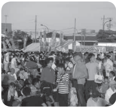
会場は多くの来場者で賑わった