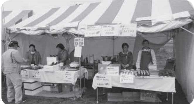
女性部員出店の様子

でんが好評で、購入していた方からはおいしいとの声をかけていただきました。販売をしながら多くの来場者の方々と会話し、触れ合うことができました。また、両日ともに輪踊りにも参加し、息の合った踊りを披露しました。部員同士の交流を深めながら販売や踊りを楽しく行いました。