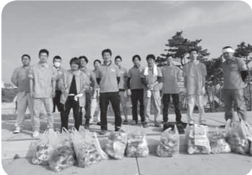
清掃後菖蒲田海水浴場にて撮影

気持ちで清掃を終えることができました。7月14日に海水浴フルオープンということもあり、東日本大震災を機に七ヶ浜の沿岸部は様子を大きく変えましたが、またあの子供達の笑顔が見れるのを楽しみにしています。私達の地域に対する思いはこれからもこの先5年、10年も変わりありません。この気持ちの灯火を絶やすことなくいつまでも素晴らしい七ヶ浜であり続け