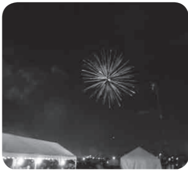
夜空に彩られた花火

今年で第27回目となる「ザ・祭りin多賀城」が8月11日、陸上自衛隊多賀城駐屯地にて開催され、約3万人の方々が来場しました。自衛隊をはじめ、多数団体が参加する盆踊りや、7グループの共演によるYOSAKOIの合同演舞などが大いに観客を楽しませていました。さらに、「たがもん」や「むすび丸」等総勢9体による「ゆるキャラPRショー」や会員事業者による模擬売店など、若者から年配の方まで楽しめるステージイベントなど市民参加型の手づくりの催しで会場は賑わいを見せていました。祭りのフィナーレでは、大きな花火がたくさん打上げられ、多賀城の夏の夜空に彩りを添えました。