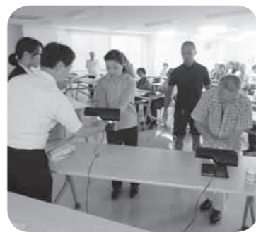
手洗い実習に励む受講者

参加者の一部の方々には汚れを確認する機器を使用した手洗いの実習をしていただき、どの部分に洗い残しが多いかをモニターを活用しながら全員で確認をしたところ、親指や指と指の間に洗い残しが多くみられることがわかりました。参加事業者は食中毒を発生させないようにするため、熱心に講習を受けておりました。これからの季節、十分に食中毒予防対策をして過ごしていただきたいと思います。