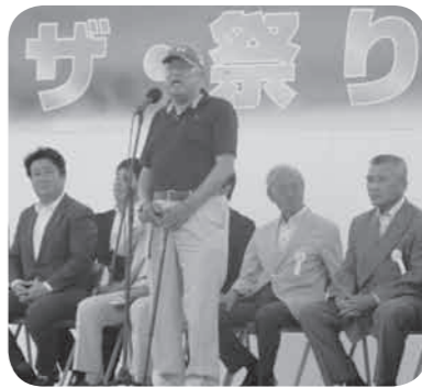
実行委員長挨拶の様子