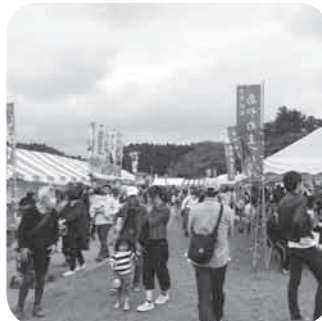
来場者で賑うあやめまつり

6月16日～6月30日の15日間、多賀城跡あやめ園にて「第30回あやめまつり」が開催され、国の特別史跡「多賀城跡」の約2万1千平方メートルに及ぶ広大な敷地に800種300万本のあやめや花菖蒲が咲き誇りました。今年も30周年を記念して夜のライトアップが実施され、照明に浮かぶ幻想的なあやめが訪れた方を楽しませました。また、郷土芸能の「多賀城鹿踊」「多賀城太鼓」をはじめとしたステージイベント、バザールエリアでは16店舗が出店し、わたあめや焼きそばといった屋台の定番メニューをはじめ、ご当地グルメフェアでは友好都市の名産品、加工品など、一押しのおいしいものが集まり、様々な飲食物が用意され、訪れた方をもてなしました。