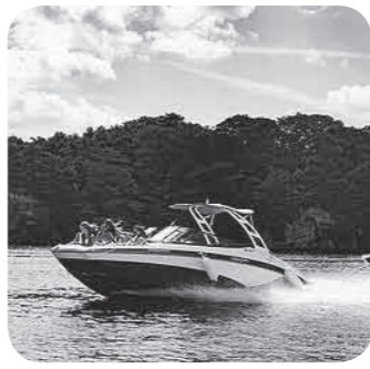
イメージ写真【クルージング】

ジャーや新鮮な海産物による飲食メニュー等による誘客企画を試験的に実施してまいります。