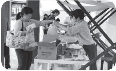
展示販売会の様子