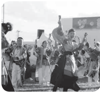
華やかな演舞を披露したYOSAKOI