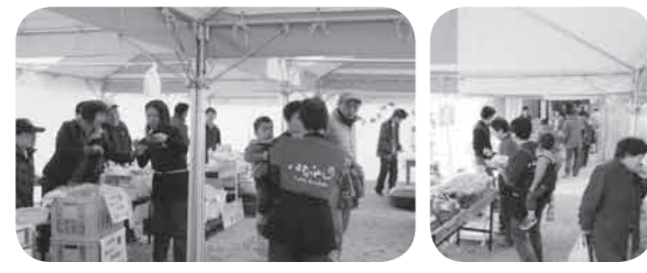
商品をPRする出展者

4月から、本会アンテナショップ「七のや」前広場において開催した本事業には、県下商工会員から30件を超える小規模事業者が出品され、地域の特産品（食品）を買い求める多くのお客様にご利用いただいております。 出展された事業者は、お客様との対面販売を通し、新たな販路開拓と商品開発の契機とするとともに、来場されたお客様は、詳しい商品の説明を求めるなど、出展者と会話を交わしながら買い物を楽しんでおります。 さらに、期間の最後にお客様の人気投票による「グランプリ」を決定いたしますので、皆さまのご来場をお待ちしております。 ※次回の開催内容は新聞折込みでお知らせいたします。