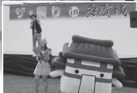
場内には「たがもん」も登場