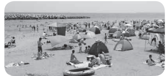
海水浴を楽しむ人々

海水浴場のフルオープンとして、「ハマの夏、全開」をコンセプトに期間中は様々なイベントが開催され、7月22日はTBC夏祭りのサテライト会場となり、29日には復興感謝祭と花火大会、8月13日はSEVEN BEACH FESTIVAL 2017が行われ大きな盛り上がりを見せました。 多くの方々お待ち望んだ菖蒲田海水浴場の再開。来年こそ暑い夏がやってくることを今から願っております。