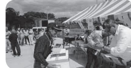
表彰を受ける参加者

6月11日、七ヶ浜町東宮浜において、「第21回七ヶ浜町釣り大会」を実施致しました。晴天の中、優勝を目指して朝の6時に9隻が出航しました。毎年楽しみにして頂いている参加者も多く、七ヶ浜町内から県外まで86名にご参加頂きました。午後1時過ぎに対象魚のカレイを釣って東宮浜港に戻りました。午後2時過ぎより表彰式を実施致し、入賞結果は、優勝83枚、準優勝82枚、3位79枚、レディース賞22枚、大物賞57cmとなりました。