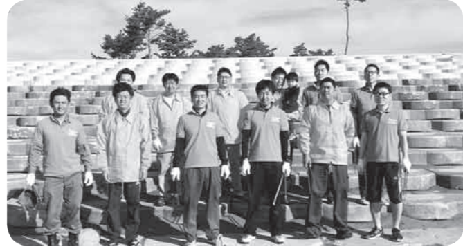
菖蒲田浜海水浴場にて撮影

東日本大震災を機に、七ヶ浜の沿岸部は様子を大きく変えてしまいました。私たちが地域に対する思いはこれまで、そしてこれからも変わりはありません。この思いを七ヶ浜やその近隣の方々と共有することで、いつまでも素晴らしい七ヶ浜であり続けることを願い、行動していきたいと心に誓いました。