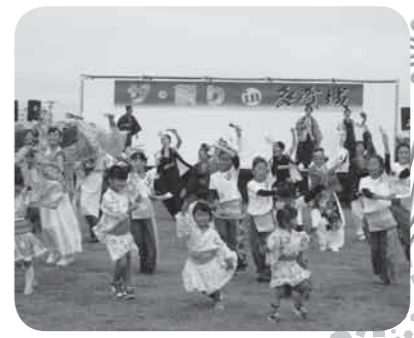
よさこい参加チームによる総おどり