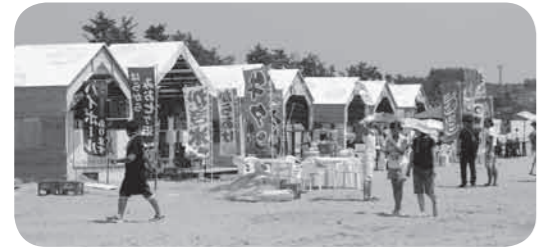
浜辺に並ぶ海の家