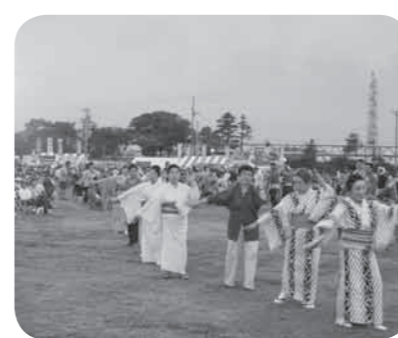
300人以上が参加した盆おどり大会

祭りのフィナーレでは、大きな花火がたくさん打上げられ、多賀城の夏の夜空に彩りを添えました。