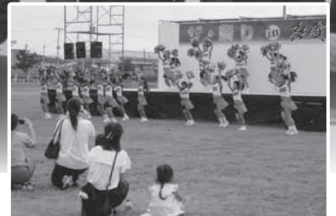
キッズアダンスのステージショー

多賀城の夏の風物詩、「ザ・祭りin多賀城」が、8月5日（土）、陸上自衛隊多賀城駐屯地にて開催され、YOSAKOIや子ども達が参加したステージショーなどの催しが行われ、多くの観客で賑わいました。（関連記事4頁）