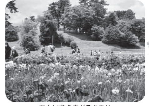
場内に咲き広がるあやめ

6月17日～7月1日の15日間、多賀城跡あやめ園にて「第29回あやめまつり」が開催され、国の特別史跡「多賀城跡」の約2万平方メートルに及ぶ広大な敷地に650種300万本のあやめや花菖蒲が咲き誇りました。また、郷土芸能の「多賀城鹿踊」、「多賀城太鼓」をはじめとしたステージイベントのほか、バザールエリアでは15店舗が出店し、わたあめや焼きそばといった屋台の定番メニューをはじめ、あやめまんじゅうといった「あやめまつり」ならではの食べ物など、様々な飲食物が用意され、訪れた方をもてなしました。