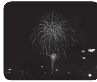
夏の夜空を彩る花火

「ザ・祭りin多賀城」が8月5日、陸上自衛隊多賀城駐屯地にて行われ、約2万人の方々が来場しました。総勢約330人が参加する東北最大の盆踊りや、多数のグループの共演によるYOSA K O Iの合同演舞などが大いに観客を楽しませていました。この他、市民参加のフリーマーケットや会員事業者による模擬売店、若者から年配の方まで楽しめるステージイベントなど市民参加型の手づくりの催しで会場は賑わいを見せていました。