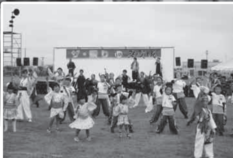
よさこい総おどり