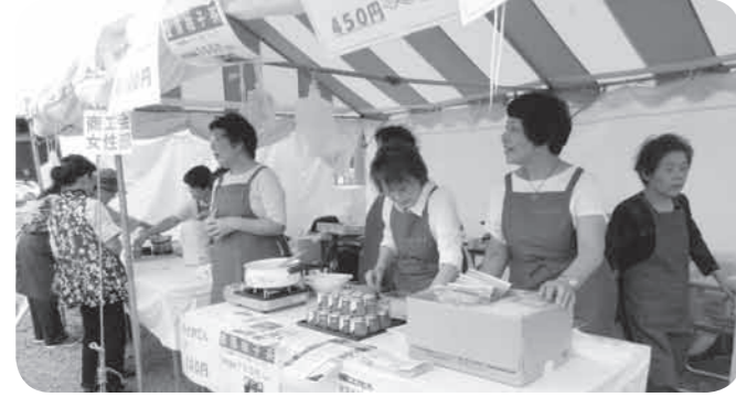
出店販売を行う女性部員